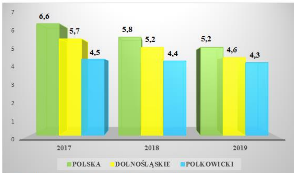
Wykres 2. Stopa bezrobocia w latach 2017 – 2019.